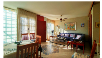
PIANO TERRA PIANO PRIMO