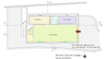
PIANTA PIANO TERRA MAGAZZINO