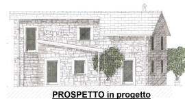
PROSPETTO in progetto