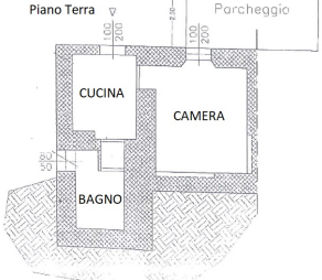
ALLOGGIO EST Piano Terra