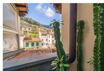
ALLOGGIO int. 7 Piano: Quarto